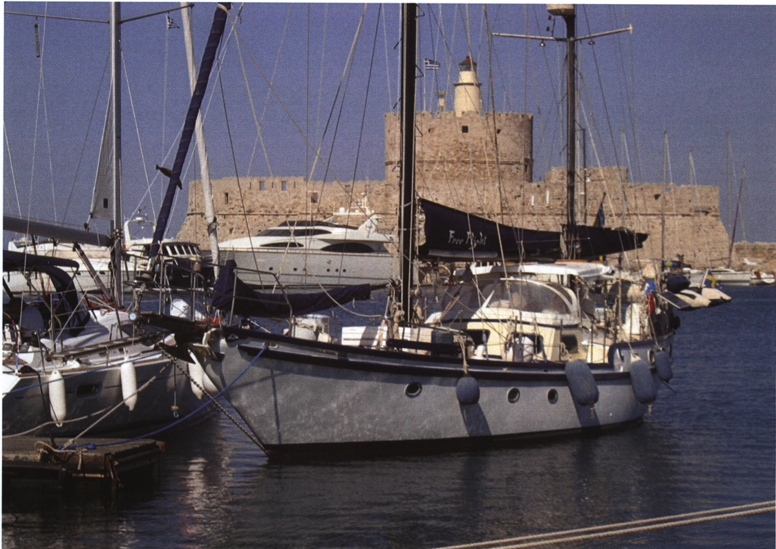
SY Free Flight i Rhodos hamn

Medlemsblad för Karlskrona Segelsällskap